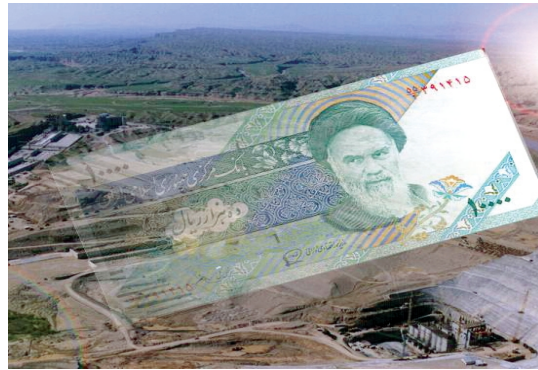
تصویر شماره ۵/نشریه سامان/شماره ۸۶