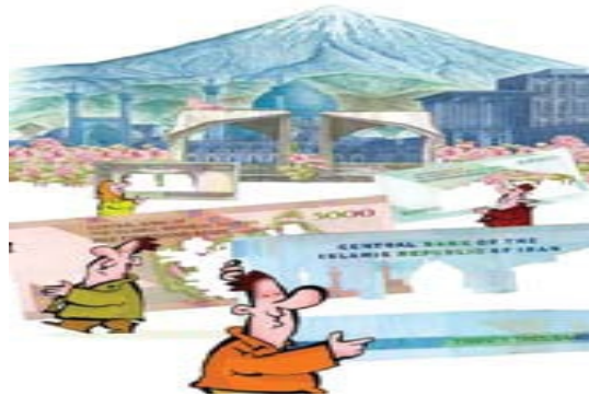
تصویر شماره ۱۰/نشریه سامان/شماره ۸۴

امروزه زنان بسیاری در جامعه ما شاغل می باشند. ارزیابی آمار کلی و وضعیت اشتغال زنان در کشور طی سال ۸۸ نشان می دهد که از کل ۲۱ میلیون شاغل کشور در این سال، بیش از ۳ میلیون و ۶۰۰ هزار نفر آن زن بود. بسیاری از این شاغلان مؤدی مالیاتی محسوب می شوند و در درآمدهای مالیاتی سهمی چشمگیر دارند. آنچه متأسفانه به صورت ملموس در تصاویر می توان حس کرد نادیده گرفتن زنان به عنوان مؤدی است. در اکثریت تصاویر مؤدیان مرد می باشند و تنها در یک تصویر مؤدی زن است که او هم اسکناسی ۵۰ تومانی در دست دارد و به نسبت دیگر مؤدیان در تصاویر که اسکناس ۵۰۰ تومانی، ۱۰۰۰ تومانی و ۲۰۰۰ تومانی در دست دارند بسیار مبلغ ناچیزی است و نشان از این است که در ذهن طراحان تصویر، زنان نقشی سطحی و بسیار ناچیز در درآمدهای مالیاتی دارند (تصویر شماره ۱۰). از طرف دیگر مالیات به صورت امری مردانه جلوه داده می شود. دستانی که به مالیات تشبیه شده اند مردانه و زمخت هستند. مالیات نه مرد است و نه زن بنابراین دستهای تصویر شده می بایست خنثی باشند. در تصاویر می بینیم که مالیات به دستانی زمخت و مردانه که پر قدرت نیز می باشند تشبیه شده است.