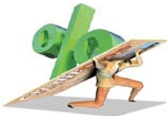
تصویر شماره ۲/نشریه سامان/شماره ۸۵