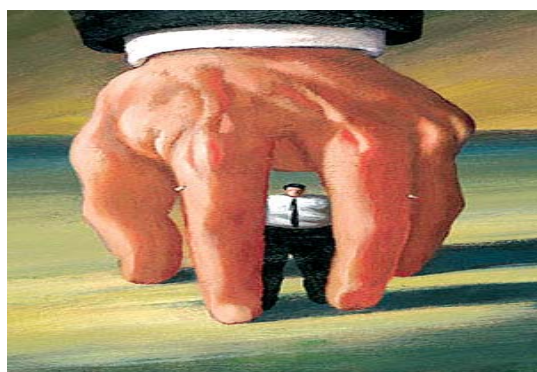
تصویر شماره ۳/نشریه سامان/شماره ۸۰