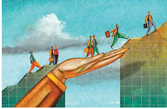
تصویر شماره ۴/نشریه سامان/شماره ی ۷۰