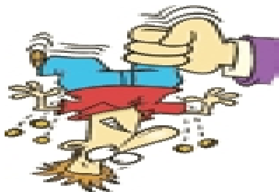
تصویر شماره ۱/نشریه سامان/شماره ۸۴