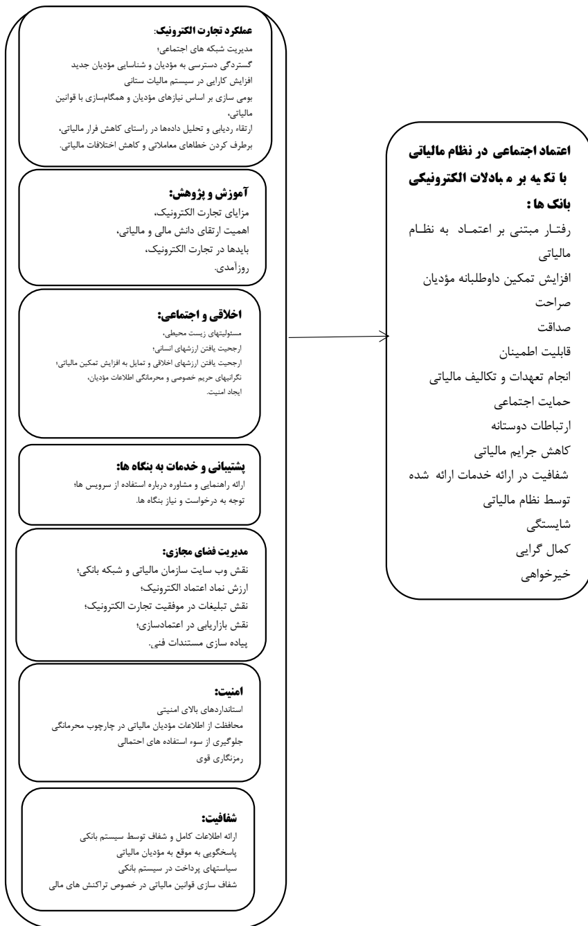
شکل ۱- اعتماد اجتماعی در نظام مالیاتی کشور با تکیه بر سازوکارهای مبادلات B2B در نظام بانکی