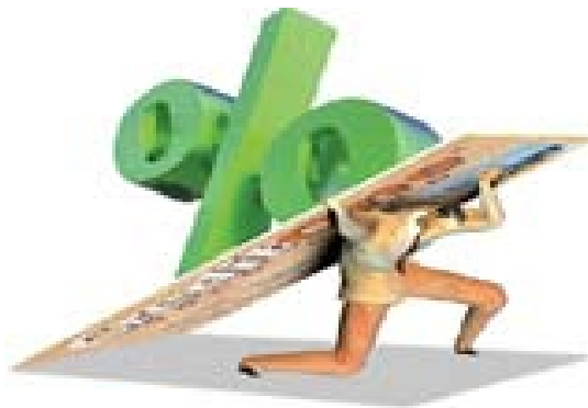
تصویر شماره ۲/نشریه سامان/شماره ۸۵