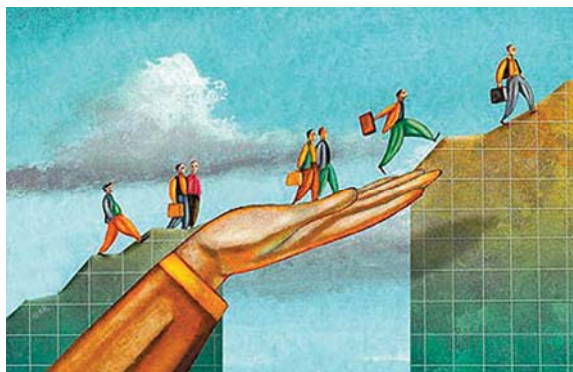
تصویر شماره ۴/نشریه سامان/شماره ۷۰