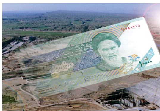
تصویر شماره ۵/نشریه سامان/شماره ۸۶