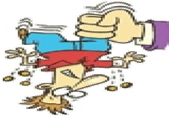
تصویر شماره ۱/نشریه سامان/شماره ۸۴