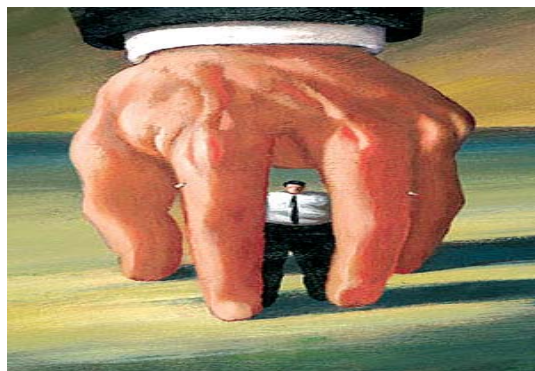
تصویر شماره ۳/نشریه سامان/شماره ۸۰