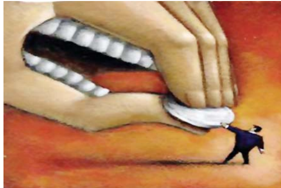
تصویر شماره ۸/نشریه سامان/شماره ۸۶