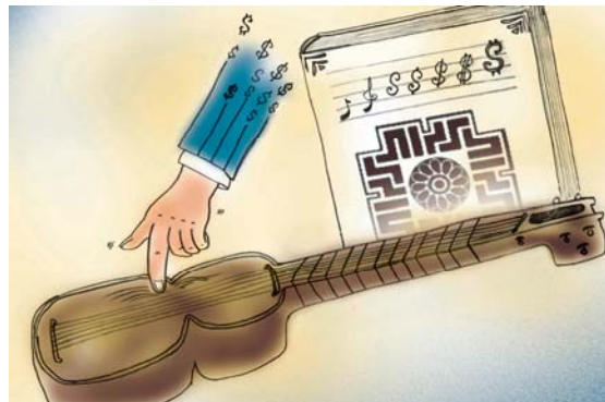
تصویر شماره ۹/نشریه سامان/شماره ۷۳