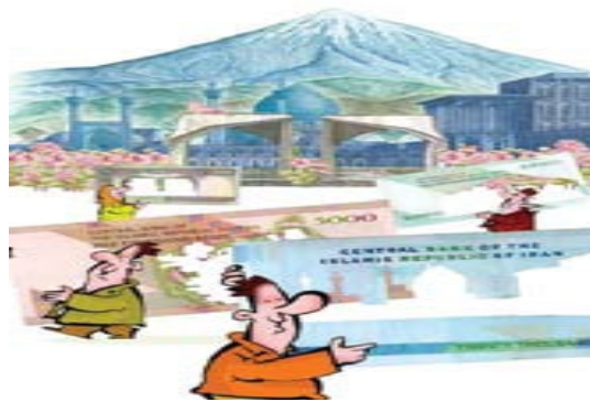
تصویر شماره ۱۰/نشریه سامان/شماره ۸۴

امروزه زنان بسیاری در جامعه ما شاغل می باشند. ارزیابی آمار کلی و وضعیت اشتغال زنان در کشور طی سال ۸۸ نشان می دهد که از کل ۲۱ میلیون شاغل کشور در این سال، بیش از ۳ میلیون و ۶۰۰ هزار نفر آن زن بود ۱ . بسیاری از این شاغلان مؤدی مالیاتی محسوب می شوند و در درآمدهای مالیاتی سهمی چشمگیر دارند. آنچه متأسفانه به صورت ملموس در تصاویر می توان حس کرد نادیده گرفتن زنان به عنوان مؤدی است. در اکثریت تصاویر مؤدیان مرد می باشند و تنها در یک تصویر مؤدی زن است که او هم اسکناسی ۵۰ تومانی در دست دارد و به نسبت دیگر مؤدیان در تصاویر که اسکناس ۵۰۰ تومانی، ۱۰۰۰ تومانی و ۲۰۰۰ تومانی در دست دارند بسیار مبلغ ناچیزی است و نشان از این است که در ذهن طراحان تصویر، زنان نقشی سطحی و بسیار ناچیز در درآمدهای مالیاتی دارند (تصویر شماره ۱۰). از طرف دیگر مالیات به صورت امری مردانه جلوه داده می شود. دستانی که به مالیات تشبیه شده اند مردانه و زمخت هستند. مالیات نه مرد است و نه زن بنابراین دستهای تصویر شده می بایست خنثی باشند. در تصاویر می بینیم که مالیات به دستانی زمخت و مردانه که پر قدرت نیز می باشند تشبیه شده است.