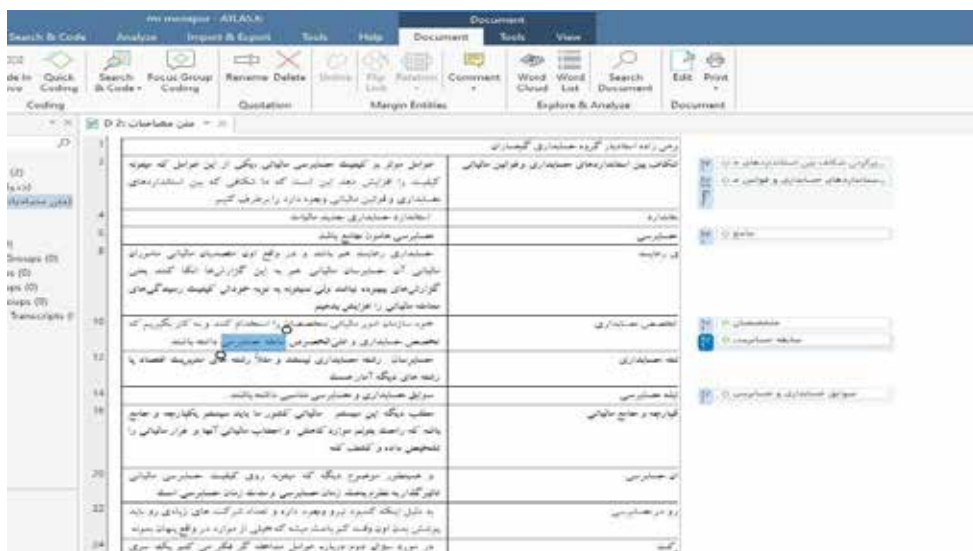
شکل (۱) - نمونه کدگذاری مصاحبه‌ها در نرم‌افزار MAXQDA